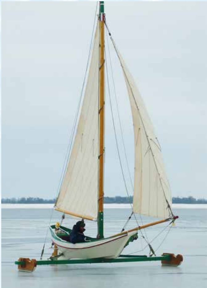
De ijszeiler Hippomenes kunt u nu op de nieuwe tentoonstelling in ons museum komen bewonderen.