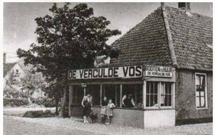
De Vergulde Vos met de bekende veranda.