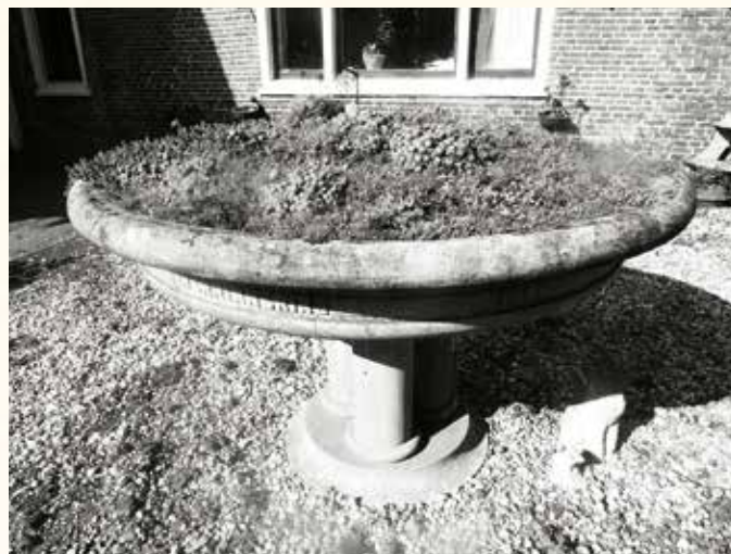
“Herinnering van de ondergedoken Sport”.