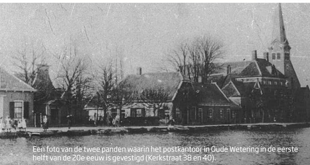
Een foto van de twee panden waarin het postkantoor in Oude Wetering in de eerste helft van de 20e eeuw is gevestigd (Kerkstraat 38 en 40).

Even later kwam mijn broer terug en trok wit weg bij het zien van de directeur. Deze vroeg hoe oud ik was en ik heb naar waarheid mijn leeftijd verteld. Toen zei hij dat hij onder de indruk was van de manier waarop ik het werk deed en dat hij de volgende dag