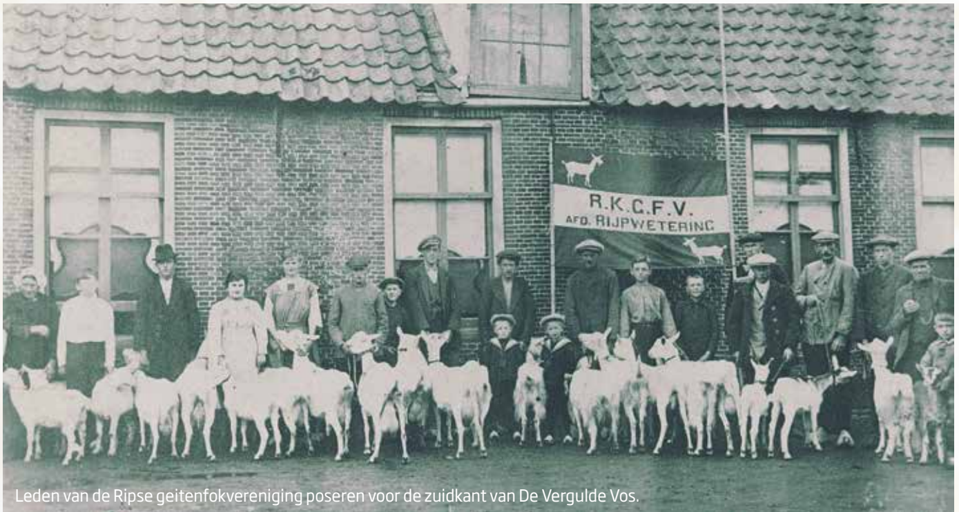
Leden van de Ripse geitenfokvereniging poseren voor de zuidkant van De Vergulde Vos.