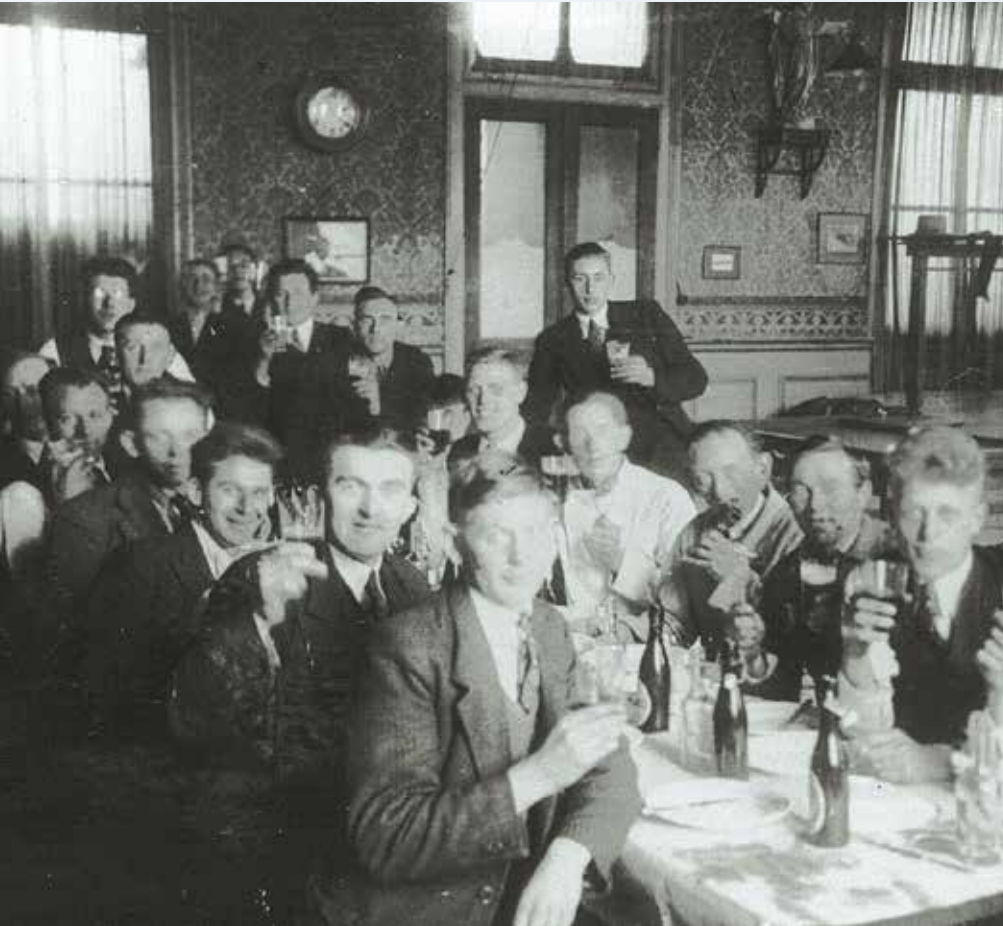
Leden van de toneelvereniging St. Pancratius heffen het glas in de achterzaal. Foto waarschijnlijk uit de jaren dertig van de vorige eeuw.

De eigenaar van café De Vier Heemskinderen, nu Pepersteeg, was vriend en concurrent, geen vijand, want we leenden de ontbijtbordjes.