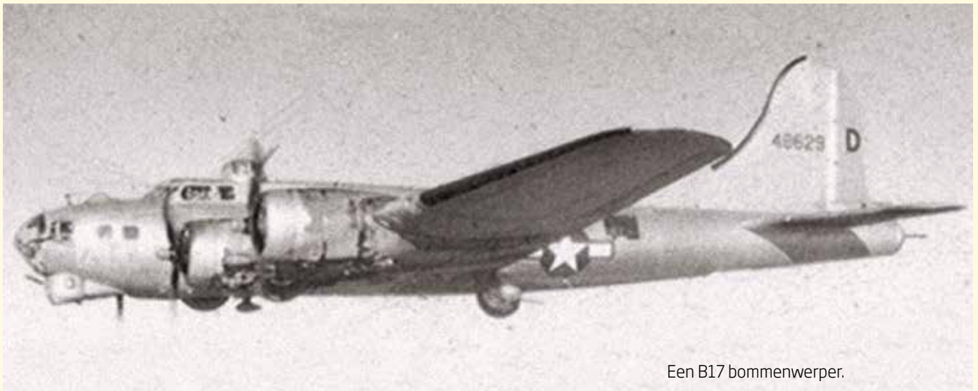
Een B17 bommenwerper.