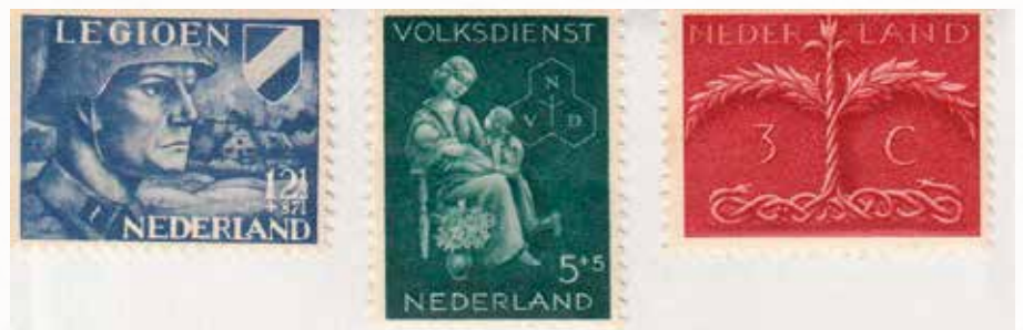
Nederlandse postzegels uit de Tweede Wereldoorlog.

Toen mijn zus aan het begin van de oorlog nog op het kantoor werkte, heeft ze met de verjaardag van Koningin Wilhelmina op 31 augustus 1940 een oranje strik om de post gebonden. Ik weet nog dat mijn broer woedend was. Ik bleef tot 1946 werken op