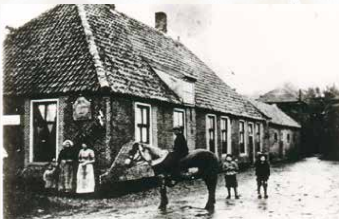
De Vergulde Vos rond 1900.