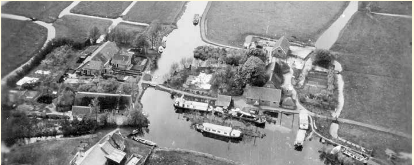
Einde Zwarteweg, Oud Ade, mei 1945.

met zgn. kakies, kaas, meel, chocolade, blikken vlees, vis en groenten en nog wat andere levensmiddelen.