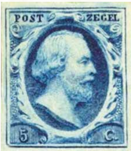
De eerste postzegel van Nederland, 1852.

In juni 1904 verschijnt er een advertentie in de Post- en Telegraafwereld. Hierin wordt een brievengaarder gevraagd